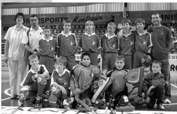
Das Junioren-Team, das in der vergangenen Saison den Schweizer-Meister-Titel holte.