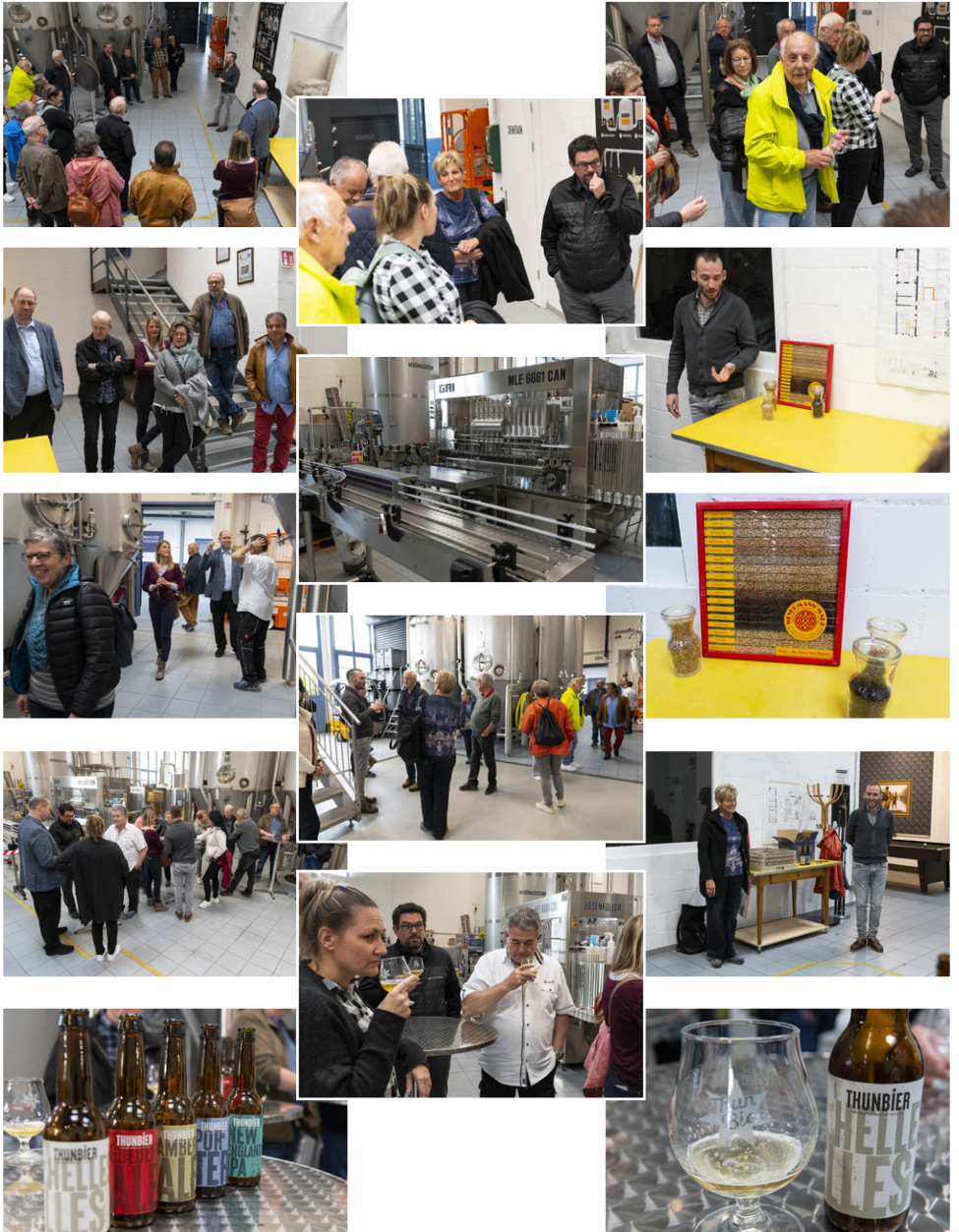
Alle Fotos findest Du auf unserer Homepage.