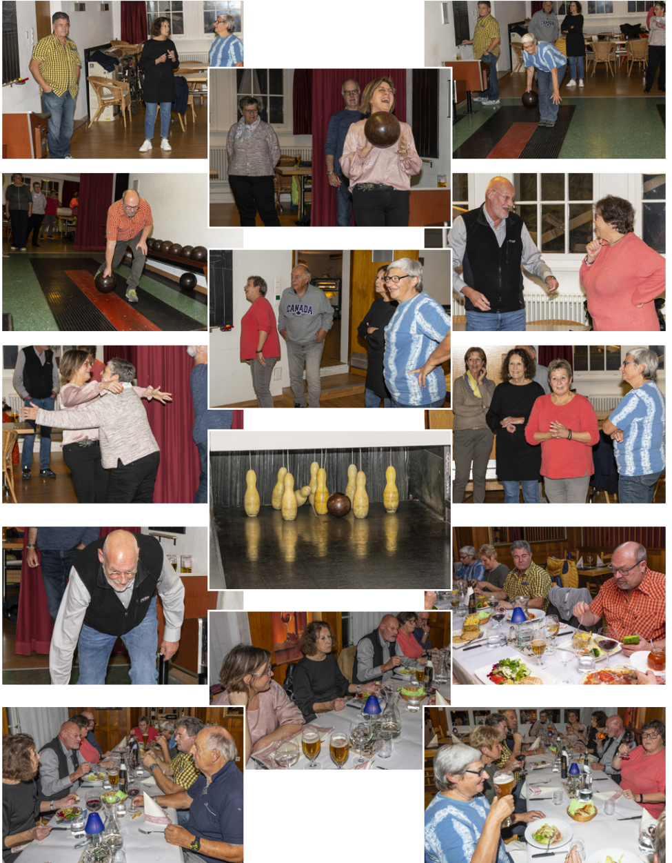
Alle Fotos findest Du auf unserer Homepage.